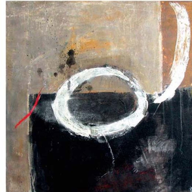
o. T., 2010, Acryl, Mischtechnik auf Leinwand, 80 x 80 cm (Abstraktion)

Das Verhältnis zwischen Flasche und Glas ist völlig überzogen, die Größenverhältnisse sind verschoben und trotzdem ist das Stilleben noch als solches zu erkennen.