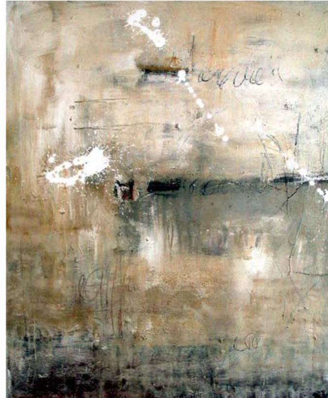
o. T., 2010, Mischtechnik auf Leinwand, 120 x 100 cm

2. Demgegenüber steht das abstrakte oder ungegenständliche Bild. Der Begriff bezeichnet in der Kunst verschiedene Strömungen der Moderne oder der zeitgenössischen Kunst, deren Merkmal sogar die völlige Abwesenheit eines konkreten Gegenstandsbezuges ist. Werke dieser Strömungen thematisieren beispielsweise die formalen Gestaltungsprinzipien selbst, die Zeichensprache des Künstlers oder auch die farblichen Veränderungen. Im ungegenständlichen oder abstrakten Bild herrscht eine Farb- und Formensprache, die dem Betrachter eine gewisse Interpretationsfähigkeit abverlangt. Er hat die Aufgabe, die Stimmung, die der Künstler auf die Leinwand bringen wollte, im besten Falle nachzuempfinden oder aber für sich selbst eine eigene Bildaussage zu erkennen.