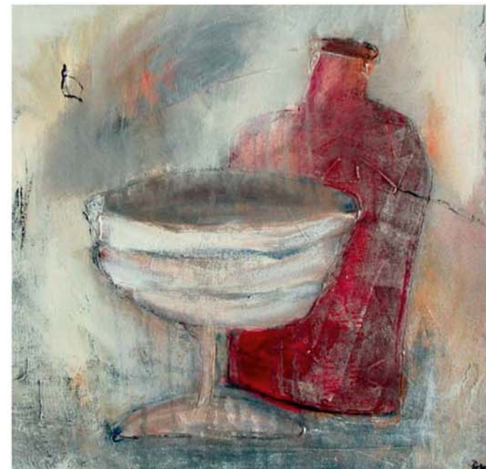
Stilleben mit Flasche, 2003, Acryl, Mischtechnik auf Leinwand, 50 x 50 cm (teilweise abstrahiertes Bild)

Ich hinterfrage immer wieder, welche Formen und Farben in mir welche Emotionen hervorrufen. Mit welchen Formen fühle ich mich wohl? Welche Stimmung kann ich durch weiche Linien, scharfe Kanten, zurückhaltende