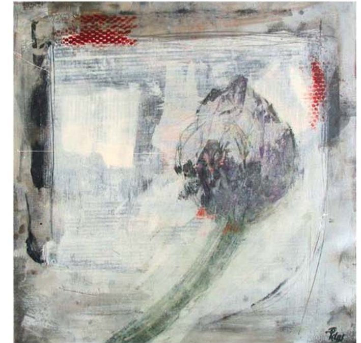
Artischocke, 2004, Acryl, Mischtechnik auf Leinwand, 60 x 60 cm (teilweise abstrahiertes Bild)

Die Artischocke wurde sehr realistisch wiedergegeben, wird aber teilweise von einem Gebilde, das wie ein Laken wirkt, verdeckt. Der Betrachter muss selbst entscheiden, was der abstrakte Hintergrund für ihn bedeuten kann.