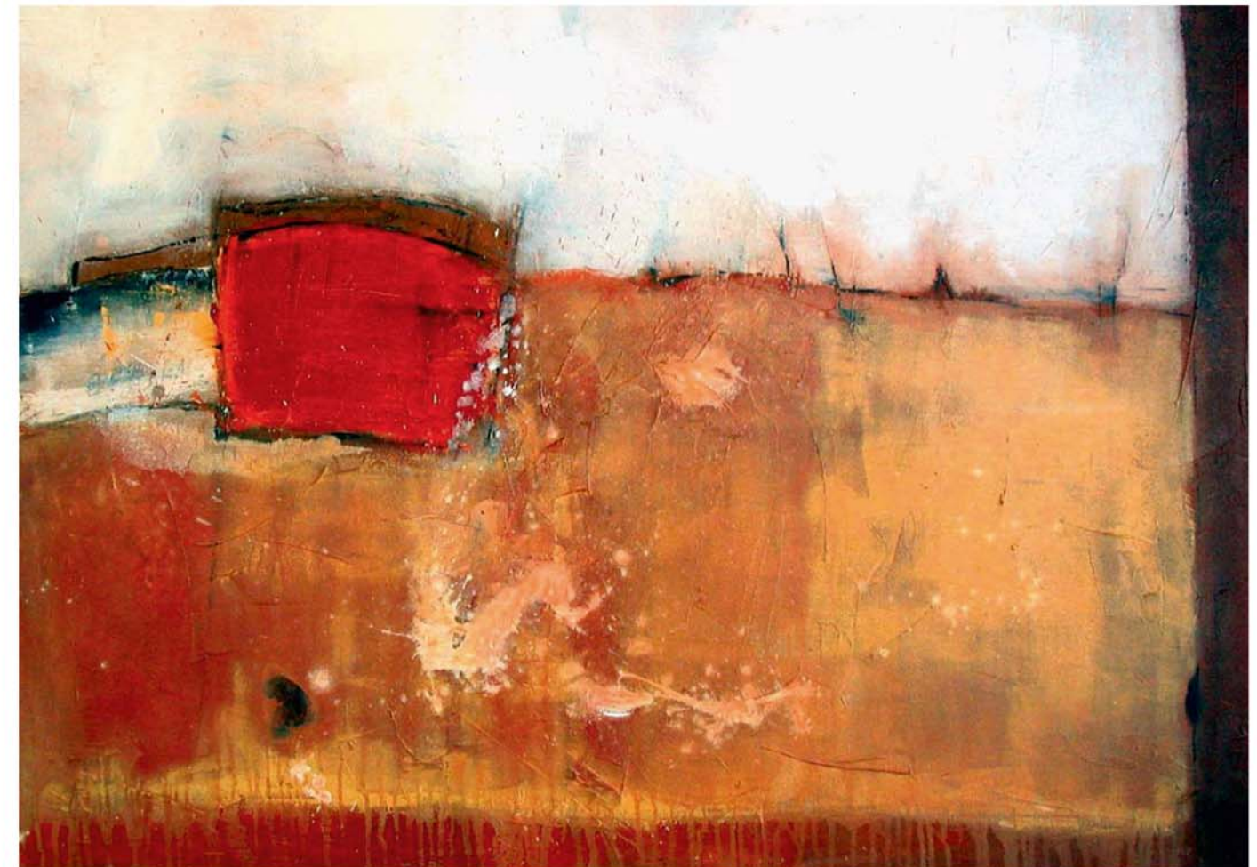
Landschaft 2, 2002, Mischtechnik auf Leinwand, 100 x 140 cm

Das Bild wurde in stark abgegrenzte Flächen unterteilt und vermittelt dem Betrachter eine klar durchdachte Bildkomposition. Die Farbe schwarz unterstützt die klare Bildaussage, das weiße Oval mindert die Härte durch die weiche Form etwas ab.